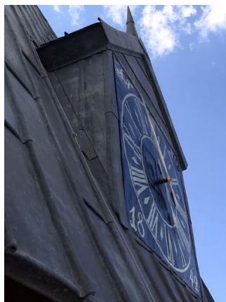
Eksempler på blytækkede tage (fotos fra filmen)