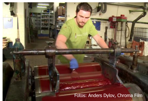
Valserivning (Thor Grabow)