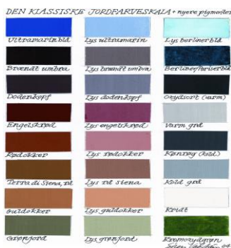
Farvekort – jordfarver