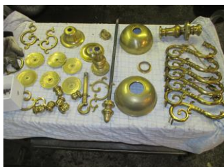
Eksempler på støbte og polerede gørtlerprodukter (fotos fra filmen)