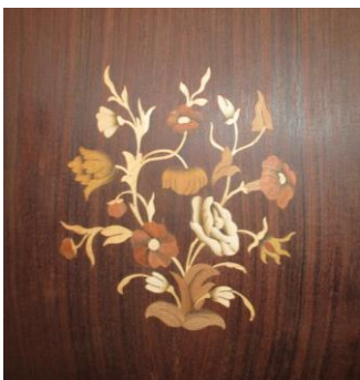
Eksempler fra før og efter intarsia-processen (foto fra filmen øverst)